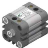
od Ø32 do Ø63