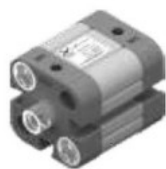
Ø20 i Ø25